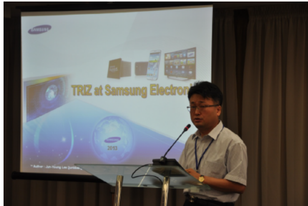
サムスン電子のイ・ジュンユン氏による基調講演