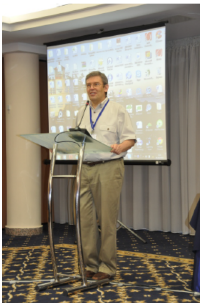
MATRIZ会長セルゲイ・イコヴェンコ博士がTRIZfest-2013の開会を宣言