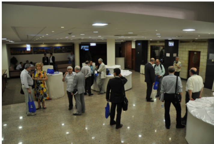
旧交を温めると同時に新しい出会いも