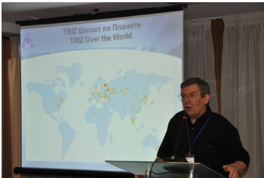
MATRIZ第8回総会にて、MATRIZ会長セルゲイ・イコヴェンコ博士が報告